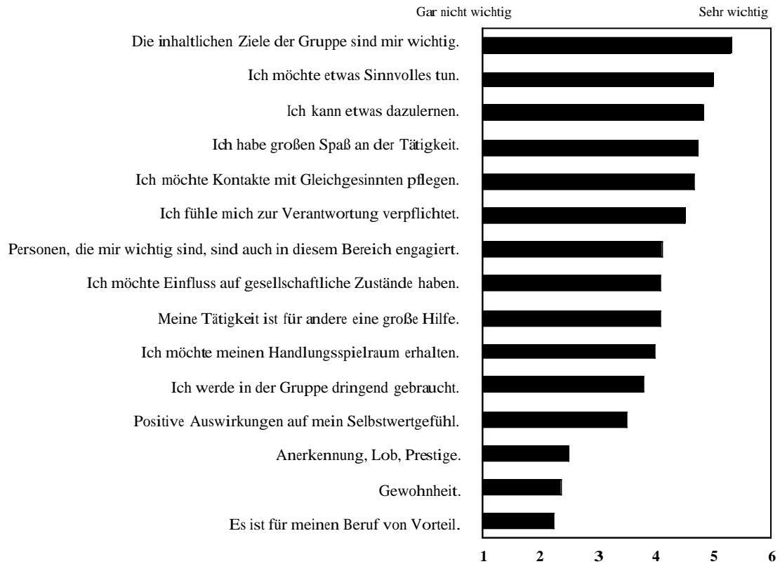
Abbildung 2: Aufrechterhaltende Bedingungen für das ehrenamtliche Engagement